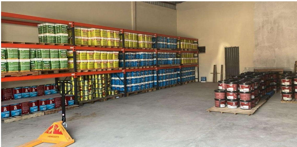
Foto material em estoque, Brita

Foto material em estoque, Selador acrílico, Tinta acrílica, Massa acrílica e pva