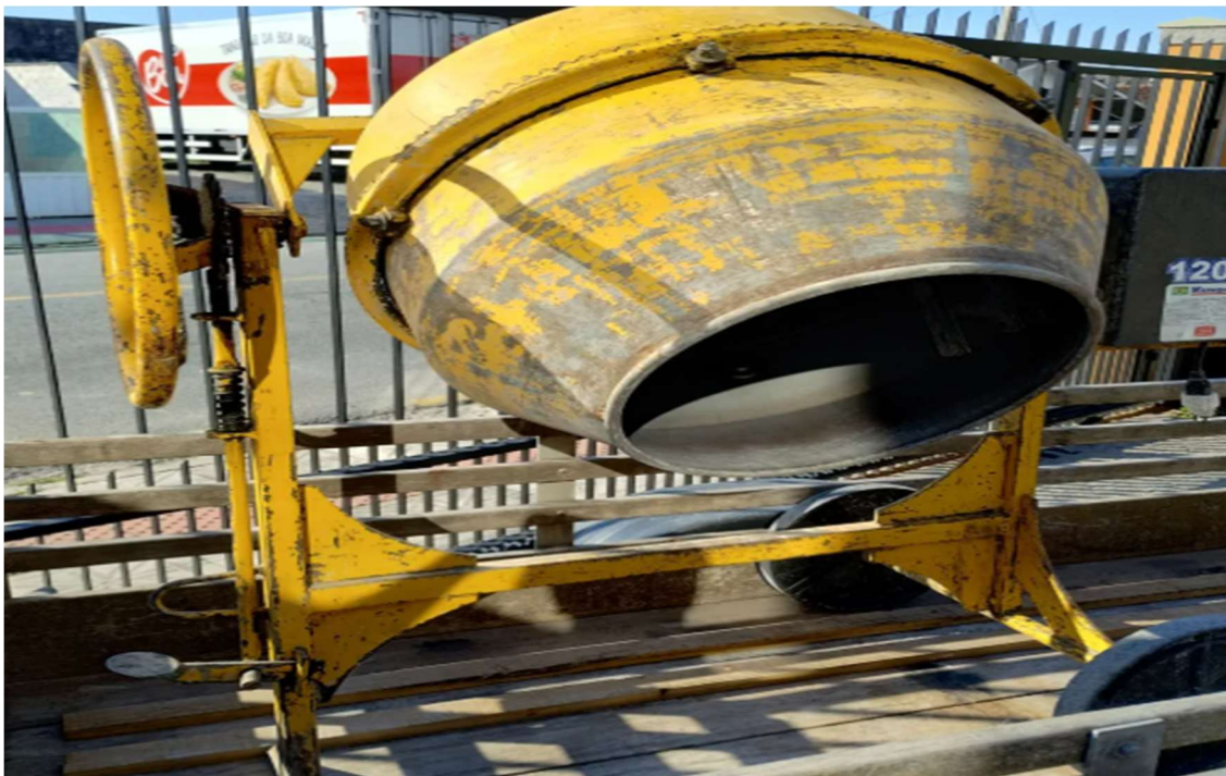
Caminhão carroceria de madeira